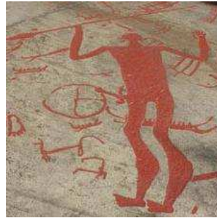
'Odin' als rotstekening

Dat de zon, en wellicht ook de maan, een belangrijke plek hielden in het spirituele gedachtegoed blijkt uit de rotstekeningen in met name Scandinavië waarin wielen met vier of meer spaken veel voorkomen als rotstekening. Deze wielen stellen hoogstwaarschijnlijk de zon voor.