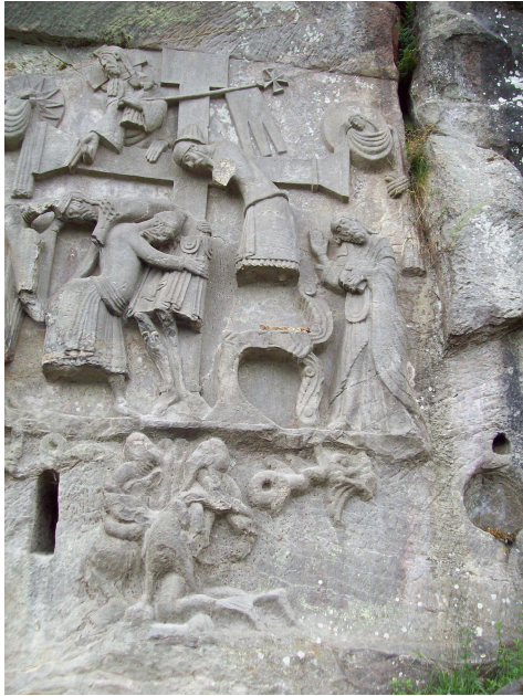
Relief op een Christelijk heiligdom bij de Externsteine dat de overwinning van het Christendom op de heidense religies uitbeeld.