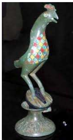
offergave aan Arcanua

De lage landen waren in de Romeinse tijd (14 vjt – 400) een overgangsgebied Keltische stammen en Germaanse stammen en een grensgebied van het Romeinse rijk. Grofweg was het gebied onder de grote rivieren bezet door de Romeinen en daarboven niet. We vinden hier dan ook invloeden van alle drie de beschreven culturen. We vinden hier dan ook alle Romeinse godheden terug. In onze streken zijn de meeste altaren gevonden die gewijd waren aan de Matrones of aan Mercurius, maar ook Jupiter en Mars waren populair in onze streken. De moeilijkheid is echter dat inheemse goden vaak de naam van hun Romeinse tegenhanger kregen. Met Mercurius wordt ook regelmatig de goden Cissonius, Gebrinius of zelfs een vroege vorm van Odin bedoelt.