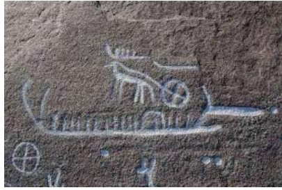
Rotstekening met zonnelymbolen

Bij diezelfde tekeningen vinden we vanaf de ijzertijd mensfiguren die vermoedelijk Goden voorstellen die we kennen uit de latere pantheons van de Germanen en Kelten. Zo zijn er afbeeldingen van een man met een bijl en een man met een speer die voorlopers van Thor en Odin kunnen zijn. Uit de Italiaanse Alpen kennen we een rotstekening die de latere Keltische god Cernunnos voorstelt.