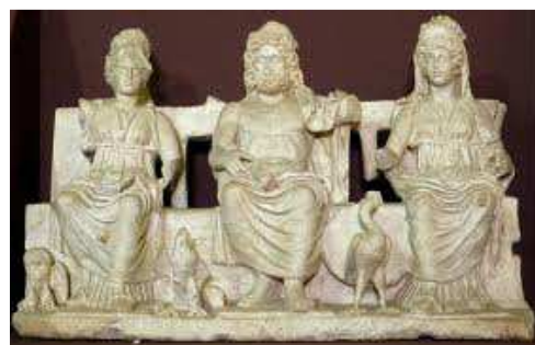
Juno, Jupiter, Minerva

De Romeinen koppelden vaak drie goden aan elkaar om gezamenlijk te vereren. De bekendste combinatie van goden is Juno, Jupiter en Minerva; ontstaan uit een Romeinse god en twee Etruskische godinnen. Deze triade was vooral populair bij de Romeinse adel, de patriciërs.